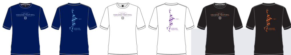
◆プリントカラー 前面：LTB/WHT 背面：LTB